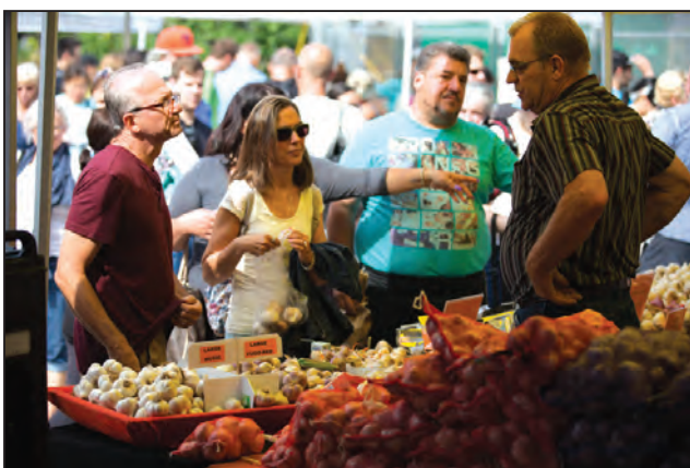
Хиляди любители на ароматния зеленчук се събраха на миналогодишния 6-ти фестивал на чесъна в Торонто. Тази година той се открива на 17 септември.